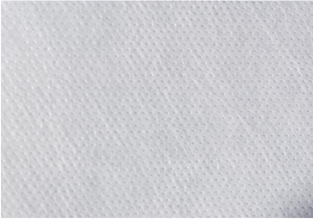
Tessuto in Polypropylene